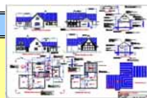
CAD Standard Image