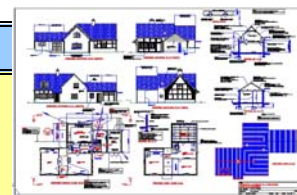
CAD Standard Image