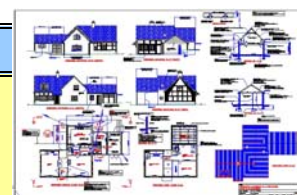
CAD Standard Image